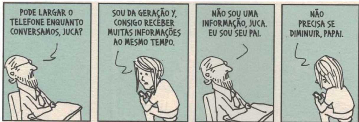
FIGURA 4 — (DAHMER, 2016, p. 160).

Por fim, na última tirinha por nós selecionada para tratar das relações entre subjetividade, neoliberalismo, sob o fio condutor da noção de dispositivo, temos um diálogo entre pai e filho, em que há, de modo mais incisivo e veemente, uma das múltiplas formas de compreensão do humano produzida contemporaneamente: a transformação do humano em um dado informacional. Essa nova compreensão é cada vez mais relevante devido à crescente massa de informações que os indivíduos contemporâneos produzem não apenas nas redes sociais, mas em quaisquer relações que tenham com o mundo online. Em uma transação bancária, ou na simples visualização ou pesquisa de um determinado produto de consumo, no tempo de permanência em um estabelecimento, uma quantidade cada vez mais ampla de informações é capturada pelos aparelhos celulares e disposta a um sem-número de empresas e multiplicadores que as maximizam e monetarizam. O próprio humano passa, assim, a ser equalizado com as demais formas de informação, passando a ser um dado entre outros no mercado do big data .