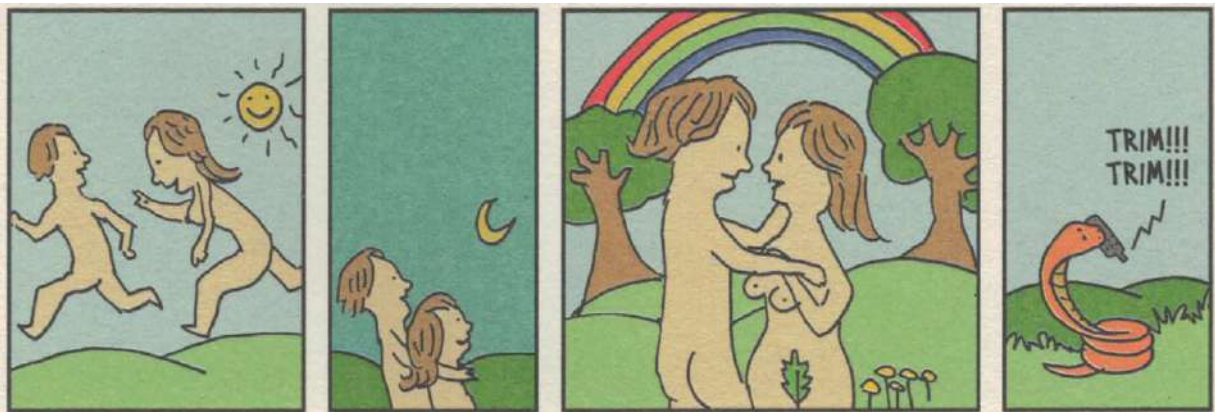
FIGURA 3 — (DAHMER, 2016, p. 248).

endemicidade da tecnologia, e, sobretudo, naturaliza a condição de constante conectividade de sua sociedade. Além disso, a evidência da normalidade, daquilo que passa despercebido como o resultado de construções, atravessamentos e recalcamientos do contato entre elementos discursivos e não discursivos, torna-se o centro do enunciado: o que é considerado relação viciosa ou relação saudável em uma sociedade dependente e definida pela impossibilidade efetiva de uma vida analógica? O que torna a relação de abuso de consumo de um fármaco mais perniciosa do que o consumo abusivo de dados? Essa distinção depende de uma quantidade dilatada de ditos e não ditos para sustentá-la, para torná-la o verdadeiro, o óbvio. Contudo, a partir de uma pergunta tipicamente foucaultiana, é possível apontar para o início de uma desconstrução arqueogenealógica que nos provoca a remontar aos processos de construção do vício como uma forma de debilidade subjetiva e, mais amplamente, como foi realizada a restrição de seu sentido para o campo dos químicos e das substâncias.