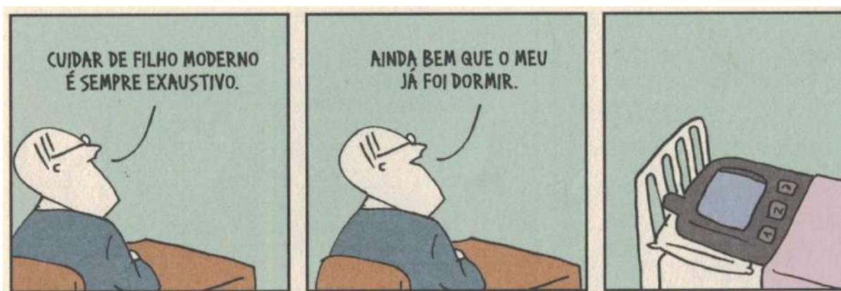
FIGURA 1 — (DAHMER, 2016, p. 141).

contemporânea dos dispositivos, na medida em que eles se tornam aparato de uma rede de relações, provocando mutações e criações de subjetividade. Os aparelhos de celular alteram a relação sujeito-objeto e modificam o sujeito, transformando não somente o sentido dos termos sujeito e objeto, mas principalmente alterando as relações possíveis entre eles.